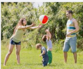
Zonas de recreación