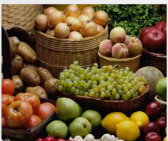
Frutas y verduras